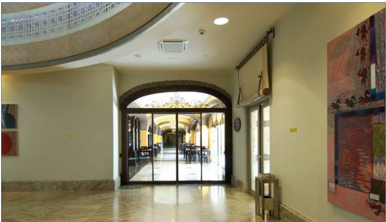
Hotel Kempinski, Antalya

Мощен мотор с 400 Ncm и капсулован редуктор, с ниско ниво на шум.